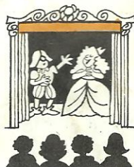
al teatro to the...